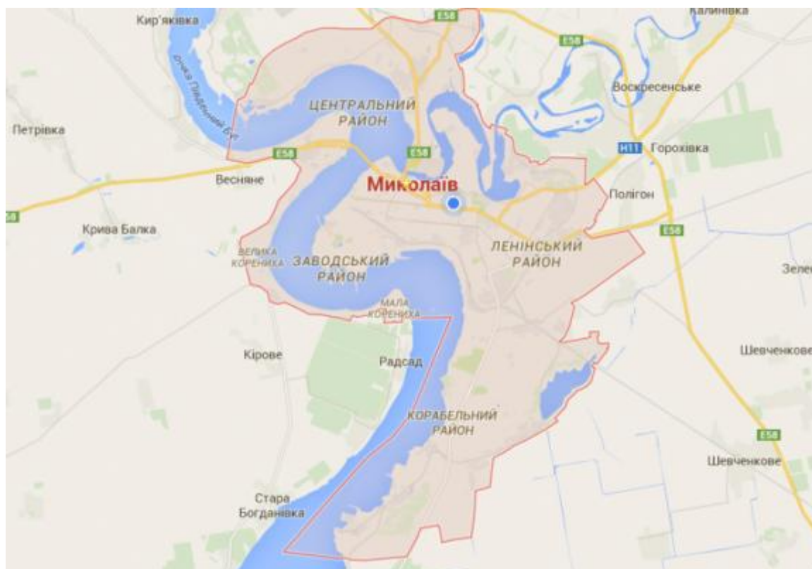
Рисунок 2.1 – карта міста Миколаїв

Місто Миколаїв — місто в Україні, обласний центр Миколаївської області, центр Вітовського і Миколаївського районів. Миколаїв розташований в Північному Причорномор'ї в гирлі річки Інгул, де вона впадає до Південного Бугу, за 65 кілометрів від Чорного моря. Це потужний політичний, діловий, індустріальний, науково-технічний, транспортний та культурний центр. Площа міста за даними голосного управління статистики в миколаївській області станом на 01.01.2019 складає 259,8 км 2 .