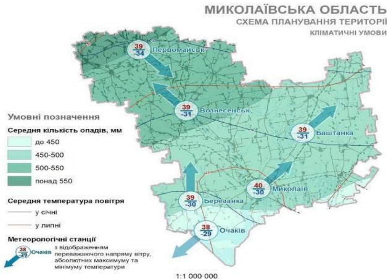
Рисунок 2.3 – Кліматичні умови Миколаївської області