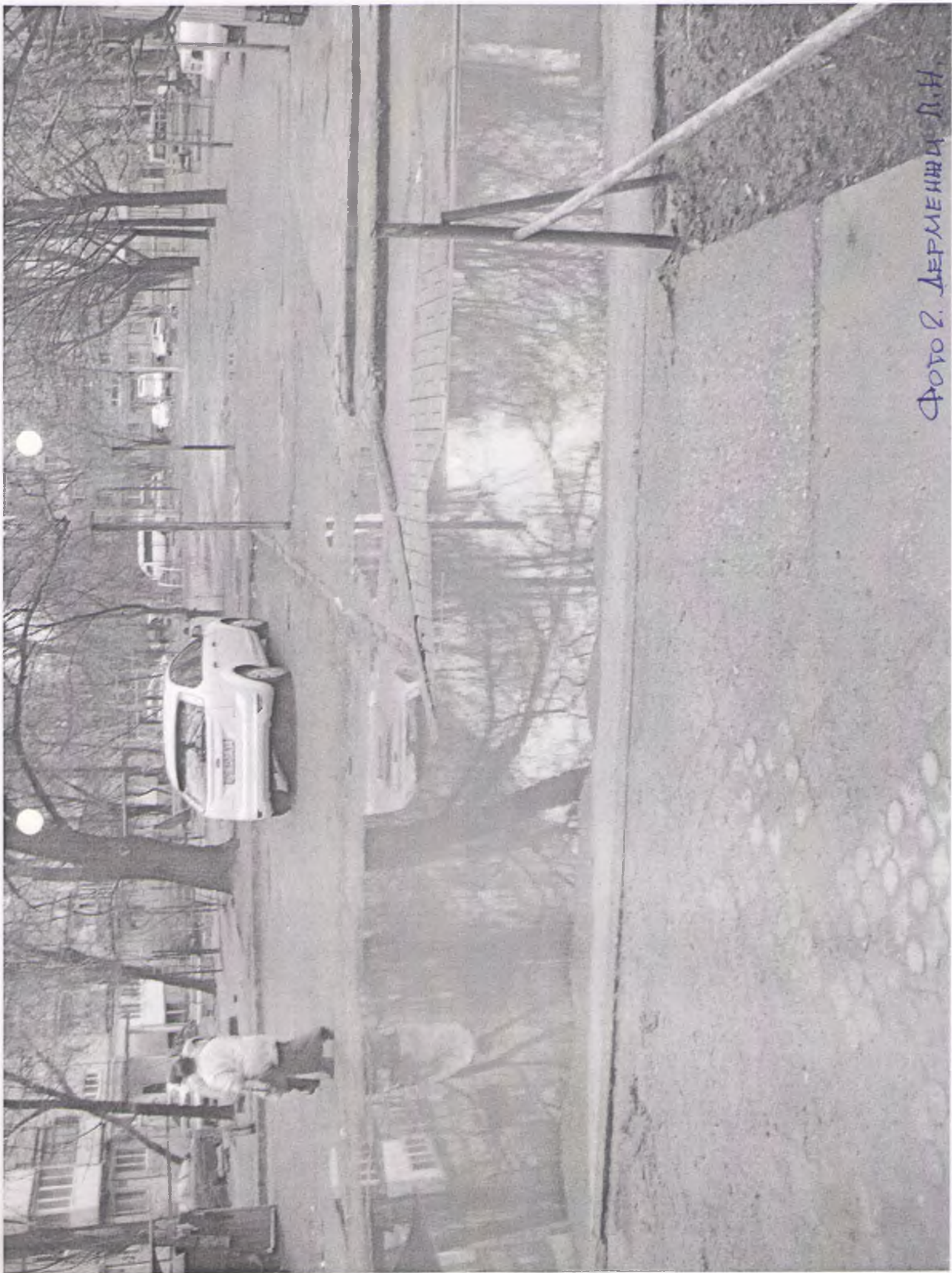
Фото 2. Деревня Д.Н.