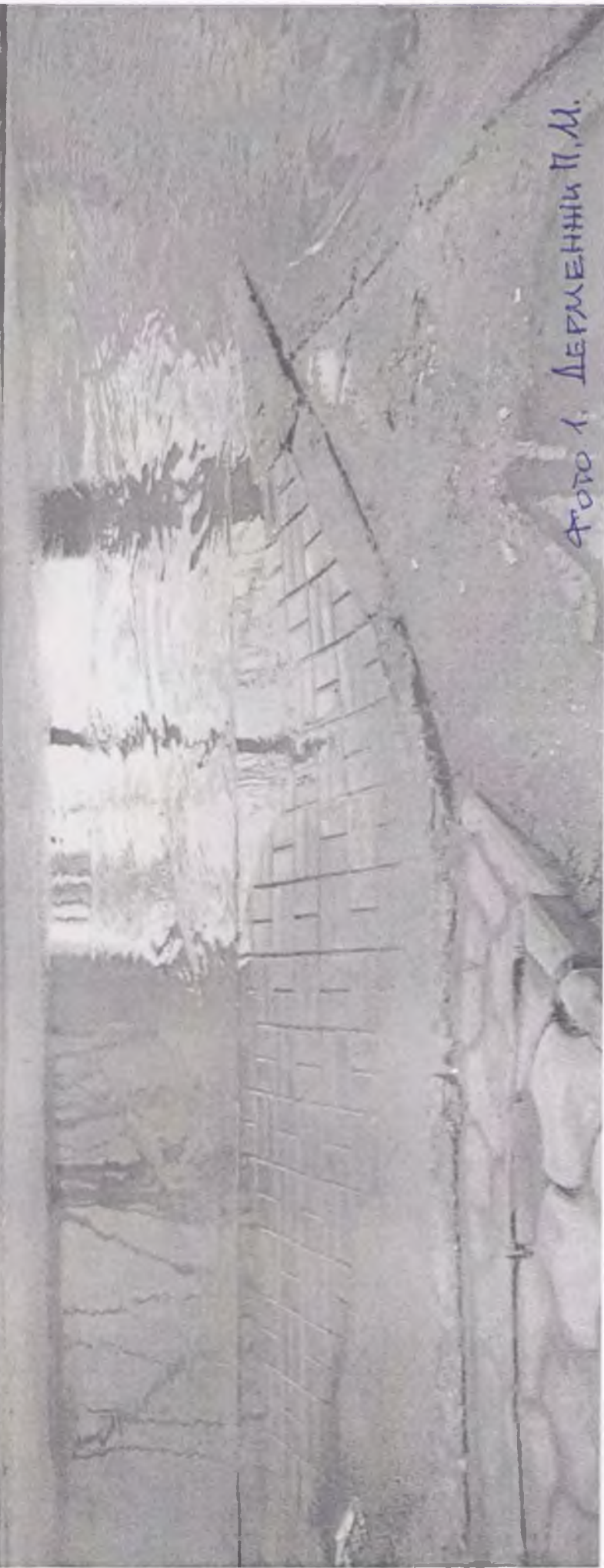
ФОТО 1. ДЕРМЕННИК П.М.