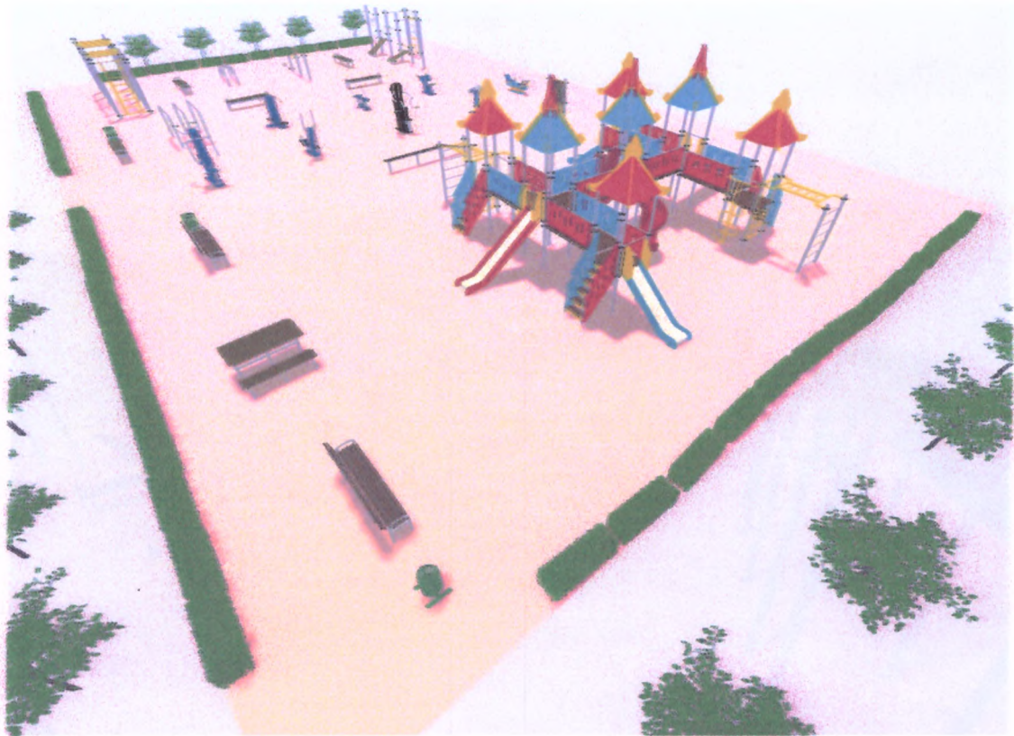
Схема розташування майданчика активного відпочинку для всіх